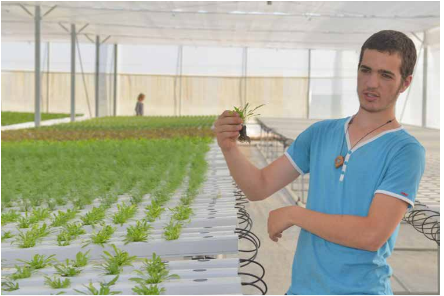
ירושלים, ישראל