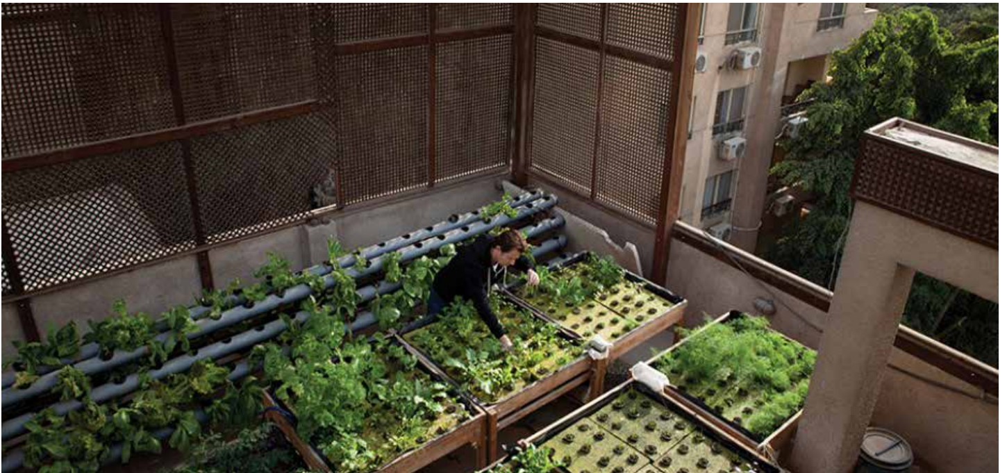
קהיר, מצרים