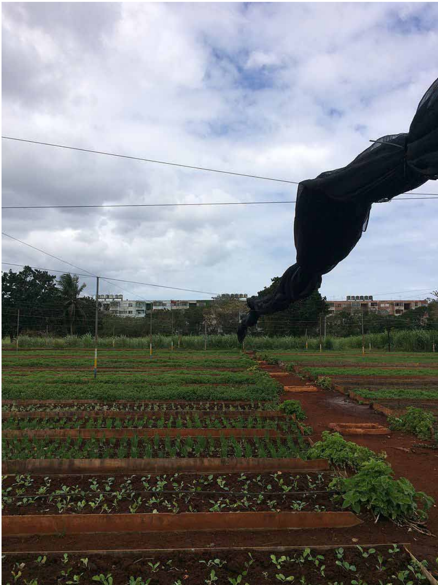
הוואנה, קובה