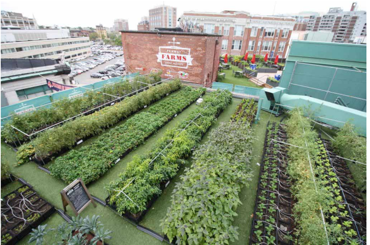
סומרוויל, בוסטון, מסצ'וסטס, ארה"ב