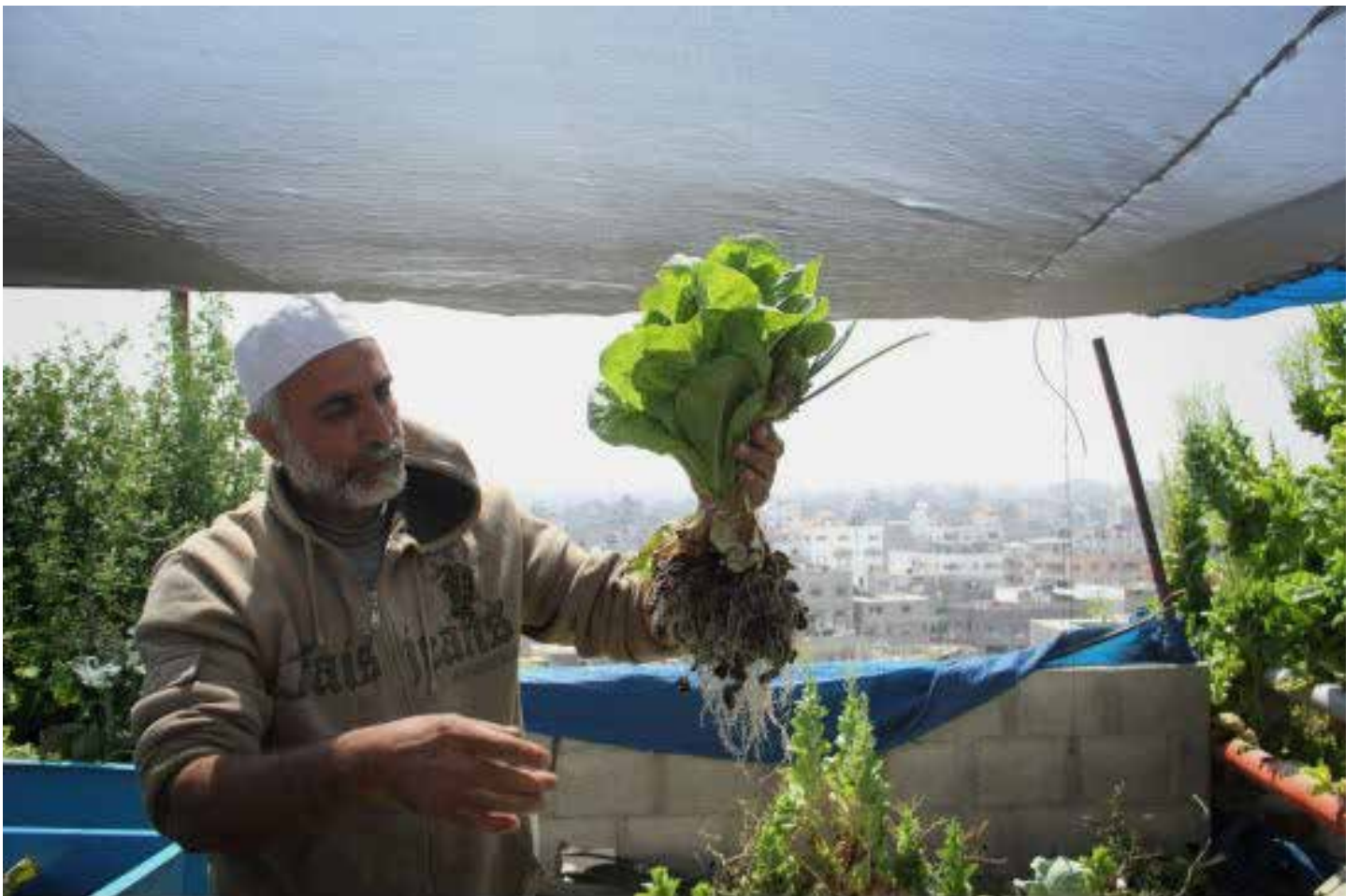
עזה, רצועת עזה