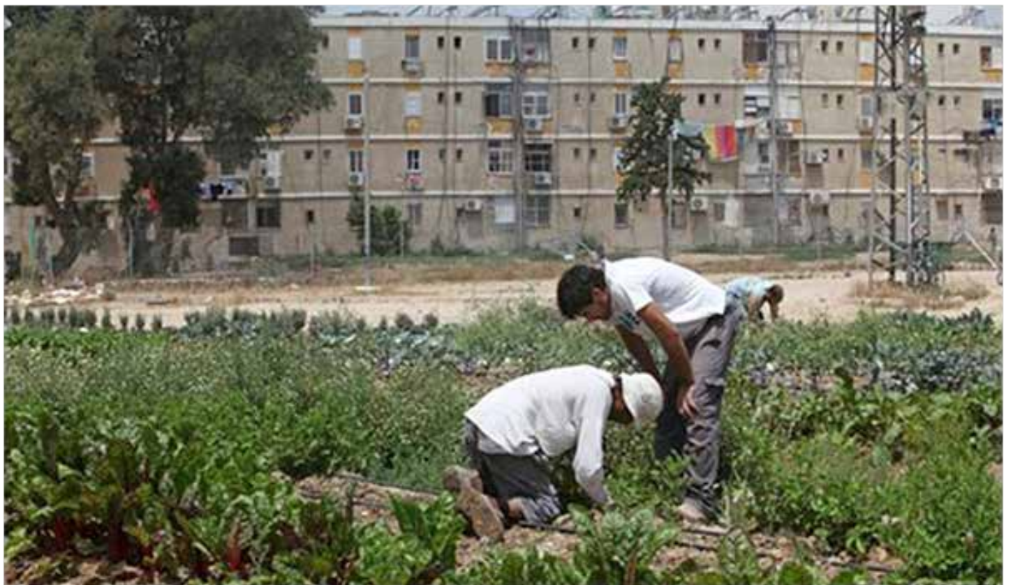
באר שבע, ישראל. לחצו על התמונה לקישור לסרטון