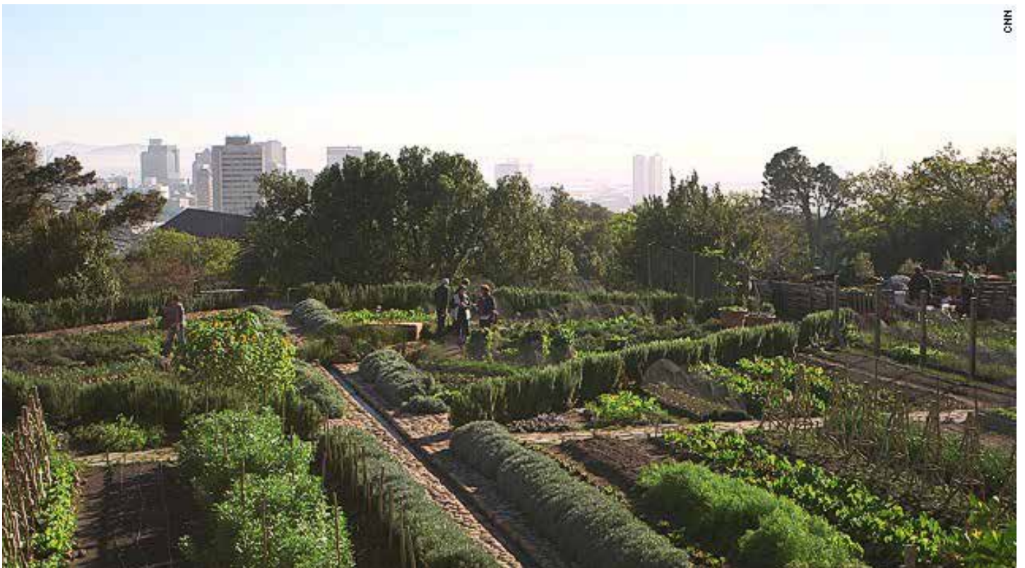
קייפ-טאון, דרום אפריקה