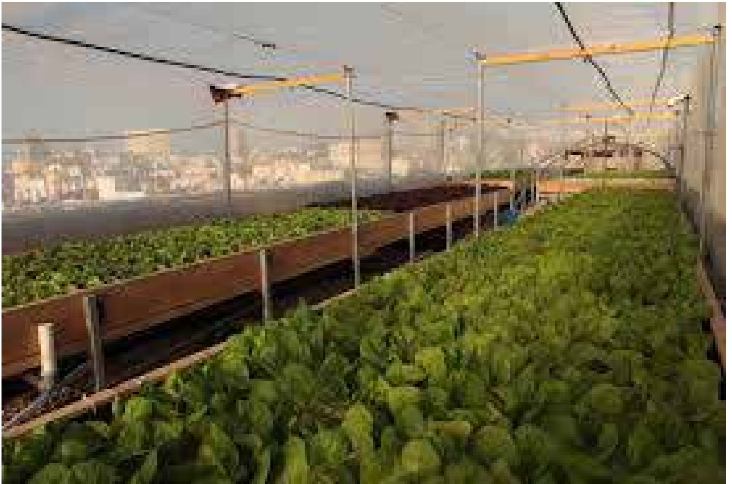
תל אביב, ישראל (קרדיט: ליווינג גרין, דיזינגוף סנטר)