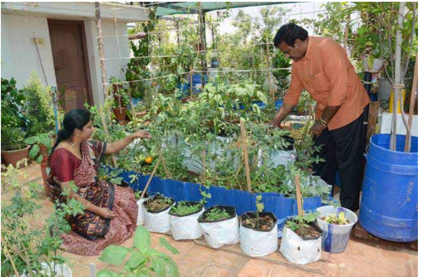
קארו, הודו