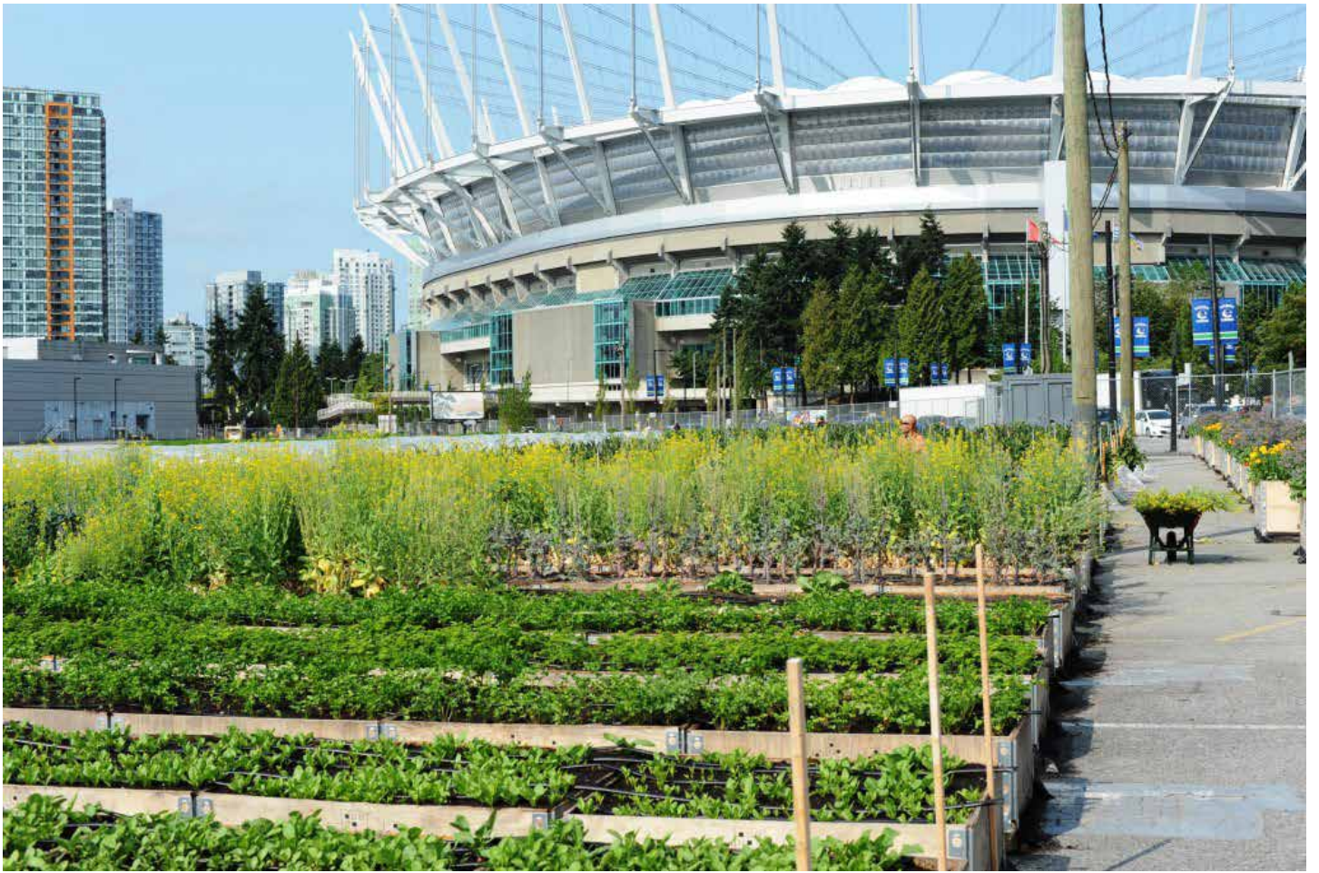
ונקובר, קנדה (קרדיט: סול פוד פארם, ארקדאליה אדריכלות נוף)