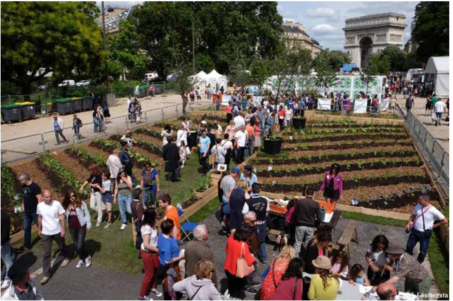
פריז, צרפת